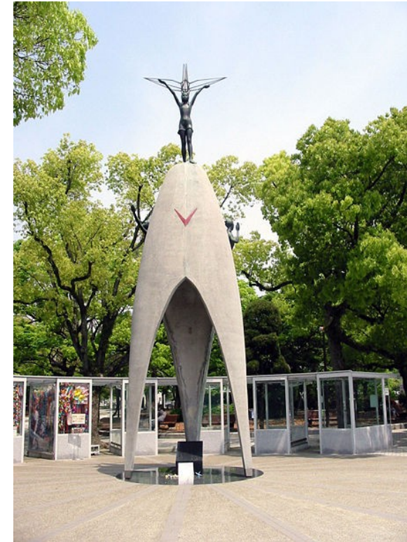
Vredesmonument van Sadako in Hiroshima